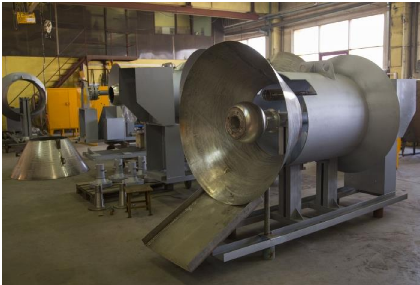
Сборка устройств горелочных горизонтальных ГПМ-УГГ

ГПМ-УГГ может комплектоваться блоком подготовки газа дежурной и запальной горелки производства ООО Завод «Газпроммаш» или любого другого изготовителя по согласованию с заказчиком. При установке ГПМ-УГГ на месте эксплуатации, входные штуцера трубопровода подвода газа на дежурную и запальную горелку соединяются с соответствующими выходными штуцерами узла редуцирования, поставляемого в комплекте с ГПМ-УГГ.